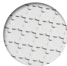
▲ detalle del fondo de la loseta